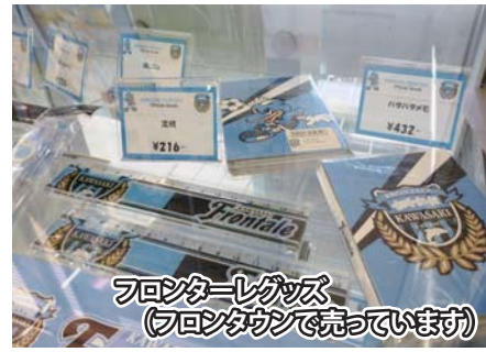
フロンターレグッズ (フロントタウンで売っています)

コーチが指導する子どもサッカー教室は、サッカー選手をめざす子どもが多く参加しています。