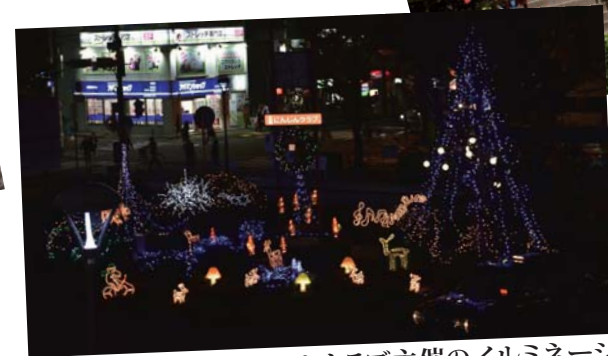
鷺沼駅前にんじんクラブ主催のイルミネーション