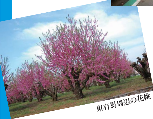
東有馬周辺の花桃