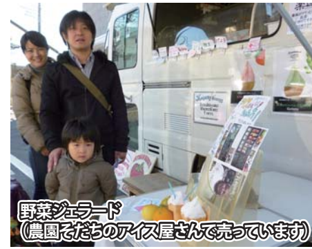
野菜ジェラード (農園で採ったアイス屋さんで売っています)

また、畑の近くの「ひばり幼稚園」の園児たちが、もぎ取り体験や野菜の成長過程をみてもらって嬉しいです。