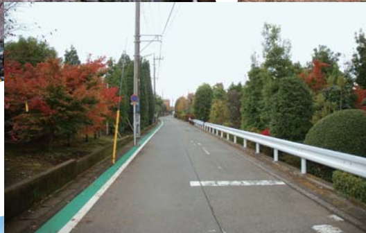
東有馬周辺の植木の里