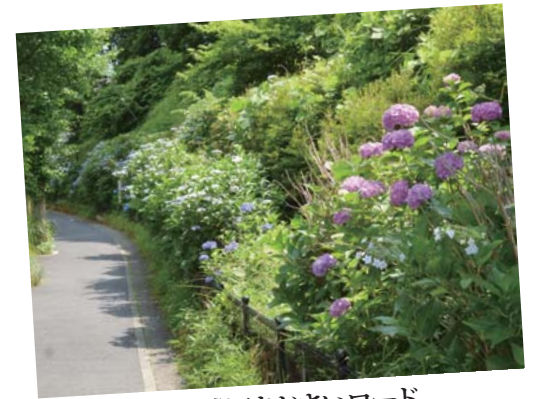
鷺沼あじさいロード