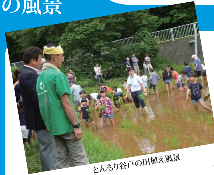
とんもり谷戸の田植え風景