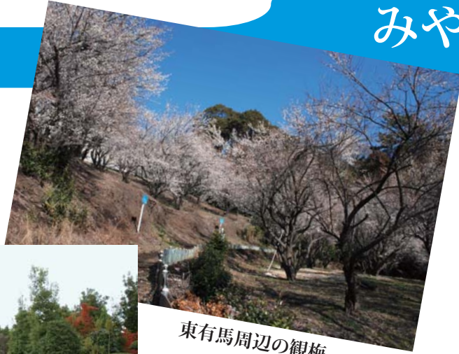
東有馬周辺の観梅