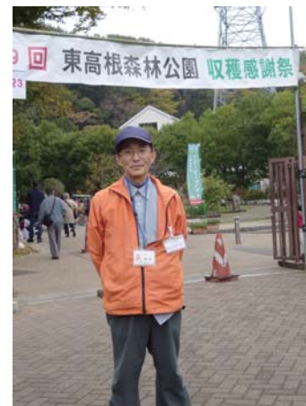
パークコーディネーターのかっちゃんです。(草笛を吹いてのおもてなし。素敵な音色にうっとりです。)