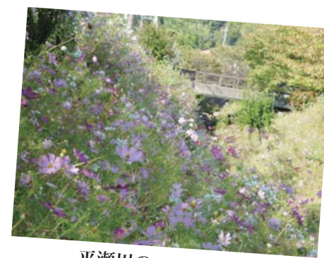
平瀬川のコスモス